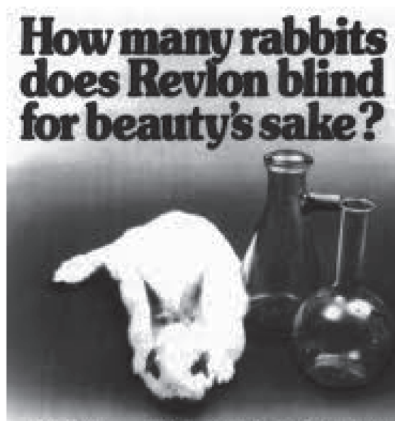
Figura 1. Ejemplo clásico de propaganda en contra de la experimentación animal

fluoresceína pasa al otro lado de la cámara.