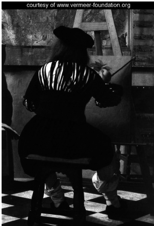
Figura 2. Detalle del cuadro “La Alegoría de la pintura”, obra realizada hacia 1666. Está realizada al óleo sobre lienzo y mide 120 cm de alto por 100 cm de ancho, por lo que es la obra más grande dentro de la producción conocida del artista. Se conserva en el Kunsthistorisches Museum de Viena (Austria). Muchos expertos creen que la obra es una alegoría de la pintura, de ahí el título con el que es conocido el cuadro.

En el otro cuadro en el que se considera que se trata de un retrato del pintor -La Alegoría de la pintura, 1666-, éste se encuentra de espaldas. Contrasta con otros pintores que o bien pintaban al pintor de frente, o si lo hacían de espaldas siempre era de manera que viéramos al menos parcialmente su rostro. Aquí no sucede así, el pintor es un artista anónimo que quizás lo único que pretende es ocultar su deterioro físico. Además observamos que el pelo pierde brillo y asemeja fragilidad, otro de los signos típicos de la anemia [Figura 2, detalle].