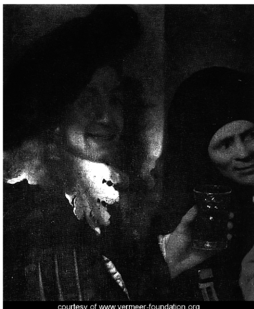
Figura 1. Detalle del cuadro “La alcahueta”, obra realizada en 1656. Está realizada al óleo sobre lienzo y mide 143 cm de alto por 130 cm de ancho. Se conserva en el museo Gemäldegalerie Alte Meister de Dresde (Alemania). Vermeer nos presenta a una mujer joven extendiendo la mano para recibir una moneda del caballero con tabardo rojo. Un segundo hombre, vestido de oscuro, observa la escena y dirige su mirada cómplice al espectador. Todos los expertos coinciden en señalar que es el propio autorretrato del pintor.

del cliente y la muchacha, una vieja -la alcahueta- y un joven músico, a la izquierda, que se vuelve hacia el espectador y levanta el vaso, como si brindara por lo que allí está sucediendo [2], [Figura 1, detalle]. Los especialistas aducen que en este personaje hay que reconocer un autorretrato del artista.